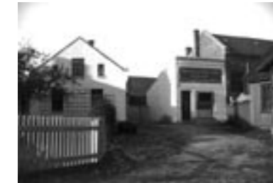
HORTEN GARVERI på hjørnet av Storgt./Løkkegt. Horten Standard overtok anlegget. (BK1045)