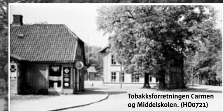
Tobakksforretningen Carmen og Middelskolen. (HO0721)