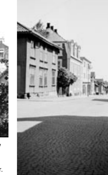
APOTEKERGATEN. Langgaten på tvers. Bare hus nr. tre står fortsatt. (HO0717)