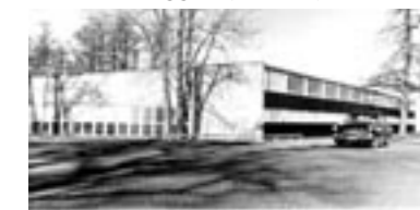
SIMRAD-BYGGET. 1962. Lidl ligger her i dag. (HO0019)