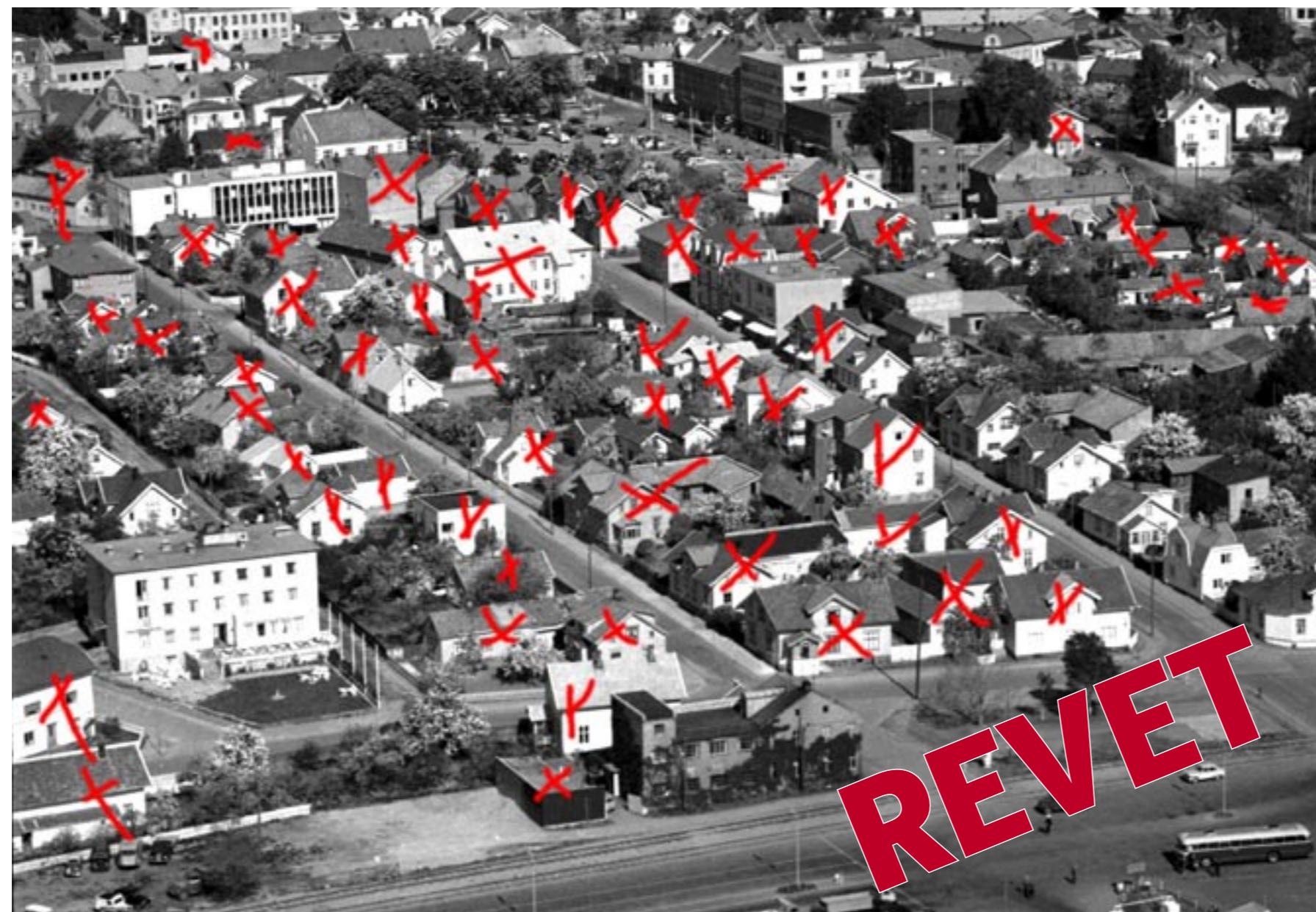
SJØSIDENKVARTALET. Tidlig 1960-tall. To hele kvartaler og en mellomliggende gate, hvor alt ble fullstendig utslettet. Her ligger i dag Sjøsidan, Biblioteket og Rådhuset. (BK2102)

I så måte er Horten et av de morsomste stedene i landet. Og morsommere skal det visst bli. Sterke krefter vil rive Den gule.