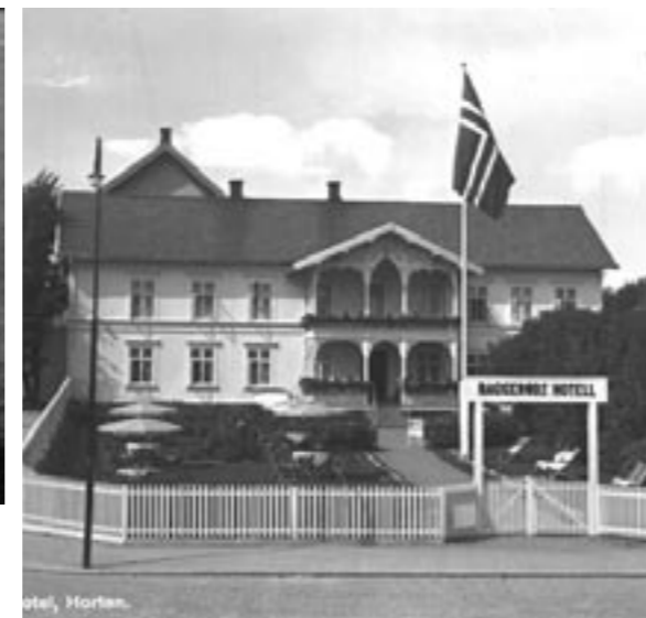
BAGGERØDS HOTELL (Hospits) i Strandgaten, på hjørnet av Fergebakken. (BH2015)