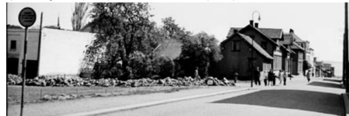
APOTEKERGATEN. Torvet og Brannstasjonen t.v. Alt er borte. (HO0718)