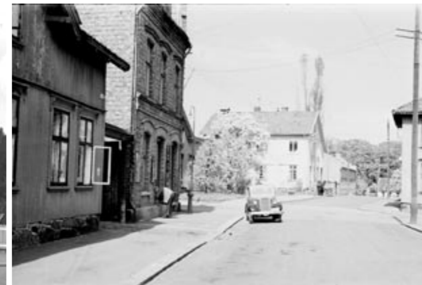
LANGGATEN. Apotekergt. på tvers. Fengselet midt i bildet. All annen bebyggelse er revet. (HO0719)