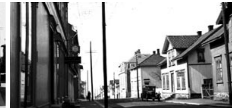
APOTEKERGATEN. Torvgården ligger nå t.v. Alt er borte. (BK1277)

I gamle dager sørget de store brannene for byfornyelsen. I våre dager er det politikerne som har overtatt den rollen.