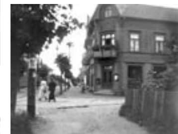
Apotekergaten/Vognmannsgaten. Alt er borte. (BK1008)