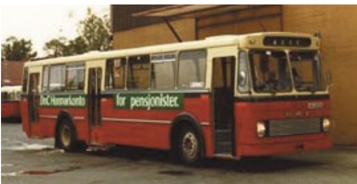
Med bladfjærer, frontmotor og manuelt gear var den et drag å kjøre.

sjef. Men det trengtes mer før en kom i gang.