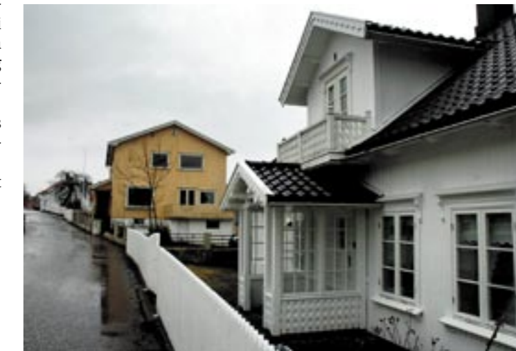
I DAG. Stangs gate 8, slik eiendommen preger gatebildet i dag, uten glassverandaen. I forgrunnen ser vi Stangsgate 10.

Vestfolds største karosserifabrikk og bilverksted like utenfor Hortens bygrense. Stedjebergs Auto A.S. skal gå igang utpå sommeren.